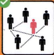
Fournir les coordonnées complètes pour le traçage.