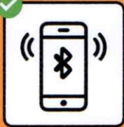
Interrompre les chaînes de transmission avec l'application SwissCovid.