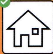
Test positif : isolement. Contact avec une personne testée positive : quarantaine.