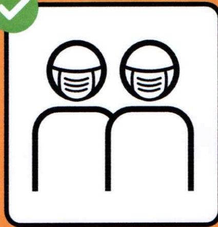
Porter un masque si on ne peut pas garder ses distances.