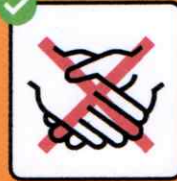
Ne pas se serrer la main.