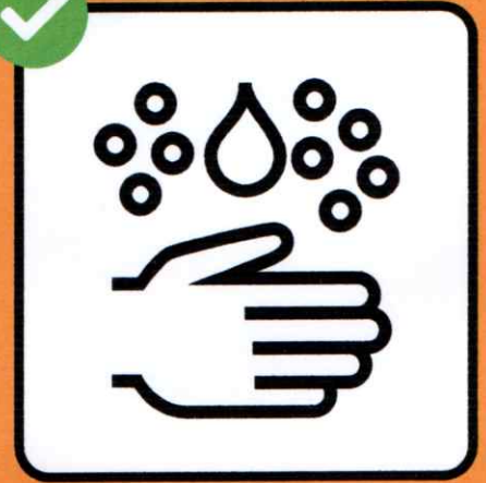
Se laver soigneusement les mains.