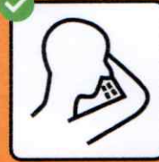
Tousser et éternuer dans un mouchoir ou dans le creux du coude.